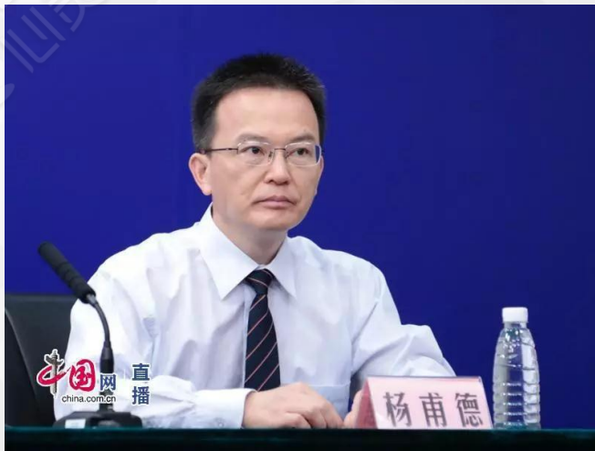
北京回龙观医院院长、主任医师杨甫德